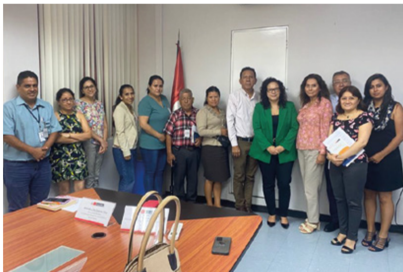
Participación en las sesiones del Grupo Sectorial