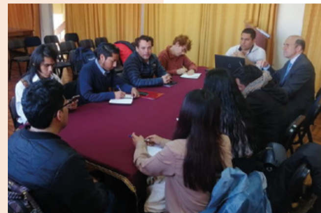
Asistencia técnica al CRTPE - Cusco