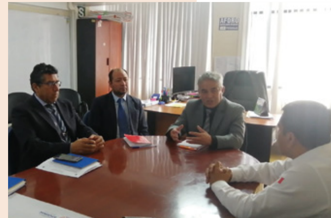
Asistencia técnica “Fortalecimiento a los actores sociales del CRTPE - Apurímac”

De igual manera, el 20 de abril, la ST-CNTPE realizó la asistencia técnica presencial al CRTPE Cusco, con reuniones de trabajo con el Gerente Regional de Trabajo y Promoción del Empleo y su equipo técnico, con líderes representantes de organizaciones juveniles y con dos expertos de la Unión Europea. La reunión con jóvenes permitió recoger información relevante y propuestas en materia de empleabilidad juvenil.