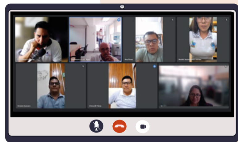
Asistencia técnica virtual al CRTPE - Ucayali

El 24 de marzo, se llevó a cabo la asistencia técnica virtual para el fortalecimiento del CRTPE - Ucayali. Durante la sesión, se realizó un análisis estratégico de este Consejo Regional y se establecieron los desafíos a superar, con el objetivo de reactivar su funcionamiento. Además, se generó el compromiso por parte de la Secretaría Técnica del CRTPE - Ucayali de convocar a una sesión del Pleno de su Consejo para avanzar en la implementación de la hoja de ruta establecida.