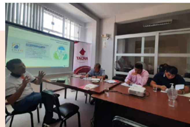
Capacitación presencial para los miembros del Pleno del CRTPE - Tacna

La capacitación, denominada “Fortalecimiento de las Comisiones Técnicas del CRTPE”, permitió establecer las acciones a desarrollar para el funcionamiento de las Comisiones Técnicas y la ruta para la formulación de políticas públicas regionales en ambas regiones.