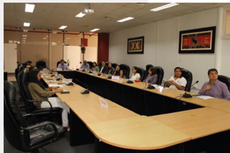
Articulación con las Direcciones Generales de Trabajo

El fortalecimiento del diálogo social implica una dinámica constante de escucha y articulación también al interior del Ministerio. En tal sentido, a iniciativa de los despachos viceministeriales, la ST-CNTPE desarrolló reuniones de capacitación y articulación con ambos despachos viceministeriales y sus direcciones generales para fortalecer las capacidades internas del sector Gobierno frente a las necesidades de los actores, dinámicas y retos que implica un diálogo sociolaboral constante.