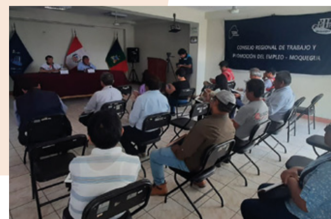
Capacitación presencial para los miembros del Pleno del CRTPE - Moquegua