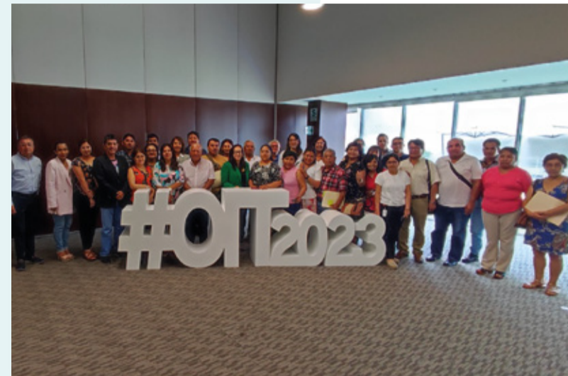
Taller “ Hacia una visión integradora del autoempleo ”