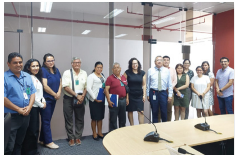
Sesión Ordinaria N° 17 del 03 de abril de 2023