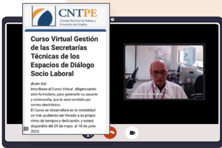
Curso Virtual "Gestión de las Secretarías Técnicas de los Espacios de Diálogo Social"