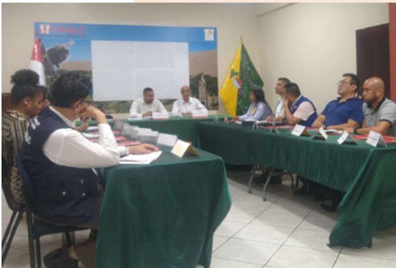
Asistencia técnica al CRTPE - Ica