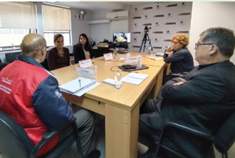
Reunión con la Asociación Peruana de Recursos Humanos (APERHU)