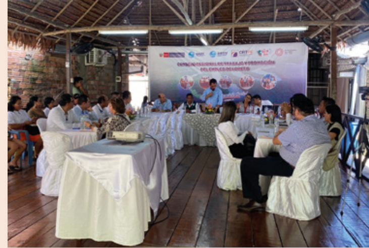
Primera sesión ordinaria del CRTPE Loreto

El 25 y 26 de octubre, el equipo técnico de la ST-CNTPE llevó a cabo la asistencia técnica presencial en la ciudad de Iquitos para fortalecer las capacidades de la Secretaría Técnica y los actores sociales del CRTPE Loreto. Durante la visita, se realizaron reuniones técnicas con los interlocutores sociales y se brindó asistencia técnica en la primera sesión ordinaria del CRTPE Loreto, que tuvo lugar el 26 de octubre. Durante esta sesión, se tomaron importantes acuerdos, incluida la actualización de la Resolución Ejecutiva Regional que crea el CRTPE para la inclusión de nuevos actores sociales, la implementación de la meta presupuestal para el CRTPE Loreto en 2024, y la reactivación de la comisión técnica de trabajo y la comisión de promoción del empleo, con planes de trabajo detallados para cada comisión.