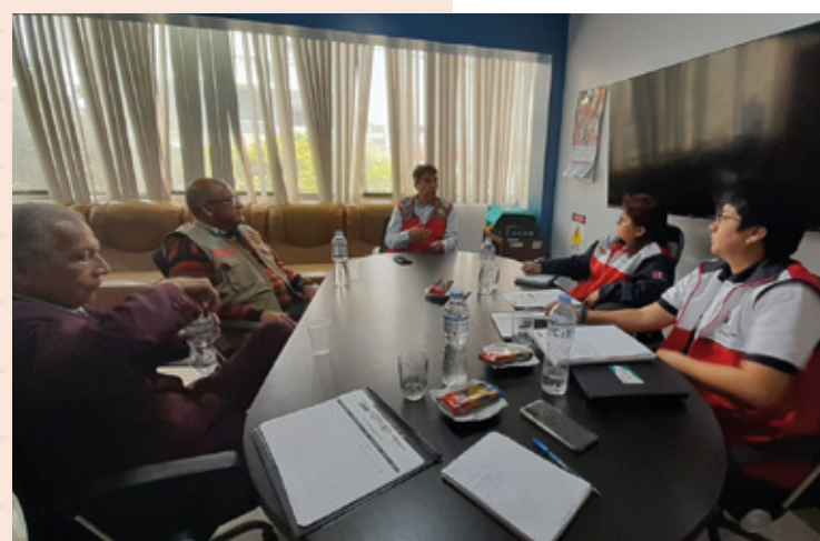
Asistencia técnica al CRTPE Áncash