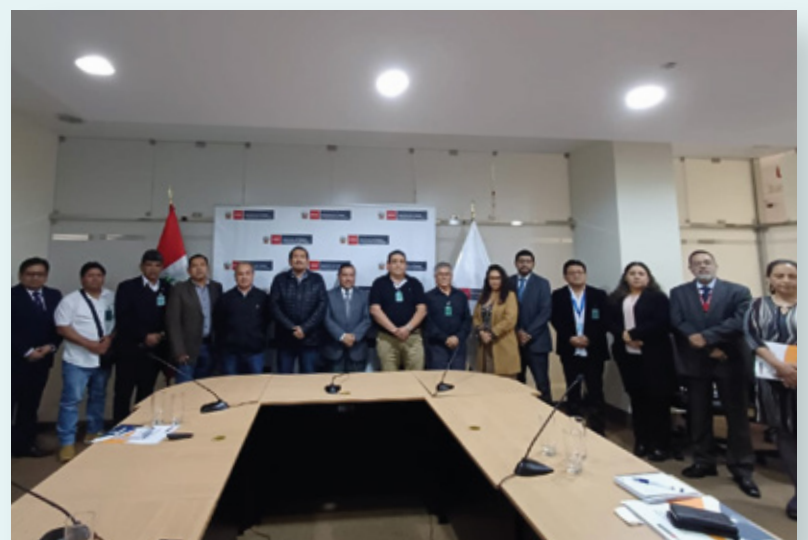
Sesión de instalación del Grupo de Trabajo Multisectorial, realizado el 11 de octubre

Con la finalidad de enfrentar el impacto del Fenómeno El Niño en el sector pesca, el 11 de octubre del presente año se llevó a cabo la sesión de instalación del Grupo de Trabajo Multisectorial, creado mediante R.M. 370-2023-TR y cuya secretaría técnica recae en la ST-CNTPE. Dicho Grupo será el encargado de proponer acciones de mitigación o contención ante los efectos del fenómeno climático de El Niño en el sector pesca, en materias sociolaboral, seguridad social y seguridad y salud en el trabajo. En esta sesión, se aprobó el Reglamento Interno y el cronograma de sesiones ordinarias. Adicionalmente, el Instituto del Mar del Perú (IMARPE) proporcionó información sobre la actividad pesquera y el impacto del Fenómeno El Niño en la pesca.