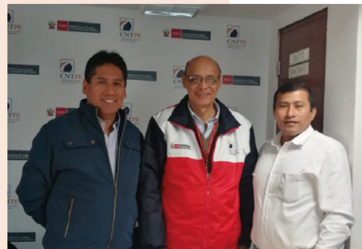
Pasantía de diálogo sociolaboral con el CRTPE Tumbes

Del 13 al 15 de setiembre, se llevó a cabo la asistencia técnica presencial al CRTPE Piura, donde se recopilaban las inquietudes de los actores sociolaborales de la región en relación con el impacto del Fenómeno El Niño. Asimismo, se realizó con éxito la sesión ordinaria N° 02 del CRTPE Piura, la cual contó con la participación de autoridades regionales, representantes de trabajadores, empleadores y organizaciones vinculadas al sector en la región Piura. Durante la sesión, se plantearon temas y puntos de agenda laboral para ser abordados en las próximas sesiones. Además, se lograron acuerdos significativos, entre ellos, se acordó: i) incorporar en la Comisión Técnica de Poblaciones Vulnerables a la Mesa de Concertación del Colectivo LGTBI, al COREJU y a la APEMYPE filial Sullana, y ii) incluir en la Comisión de Promoción del Empleo a la Municipalidad Distrital de Castilla y a la Oficina Regional de Atención a las Personas con Discapacidad (OREDIS).