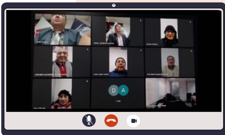
Capacitación virtual brindada al CRTPE Pasco

La capacitación abordó temas esenciales como derechos, deberes, estructura orgánica y cifras del mercado sociolaboral. Con el CRTPE Pasco, se planteó la necesidad de actualizar la conformación del CRTPE y descentralizar el diálogo a nivel provincial. Con los CRTPE de Huánuco y San Martín, se delinearon acciones para optimizar la operatividad de las comisiones técnicas, destacando el compromiso con el fortalecimiento del diálogo sociolaboral en estas regiones