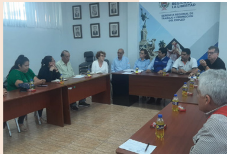
Sesión del CRTPE La Libertad

Los días 21 y 22 de setiembre, el equipo técnico de la ST-CNTPE realizó la asistencia técnica presencial en la ciudad de Chimbote con el objetivo de reactivar la Secretaría Técnica y fortalecer la participación de los actores sociales del CRTPE Áncash. Durante estas jornadas, se realizaron reuniones de trabajo con representantes de los sectores trabajador y empleador, así como con instituciones vinculadas. Durante estas interacciones, se recogieron las preocupaciones y temas de interés de los actores sociales, generando compromisos por parte de los miembros del CRTPE Áncash.