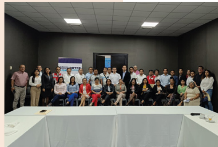
Sesión ordinaria N° 02 del CRTPE Piura