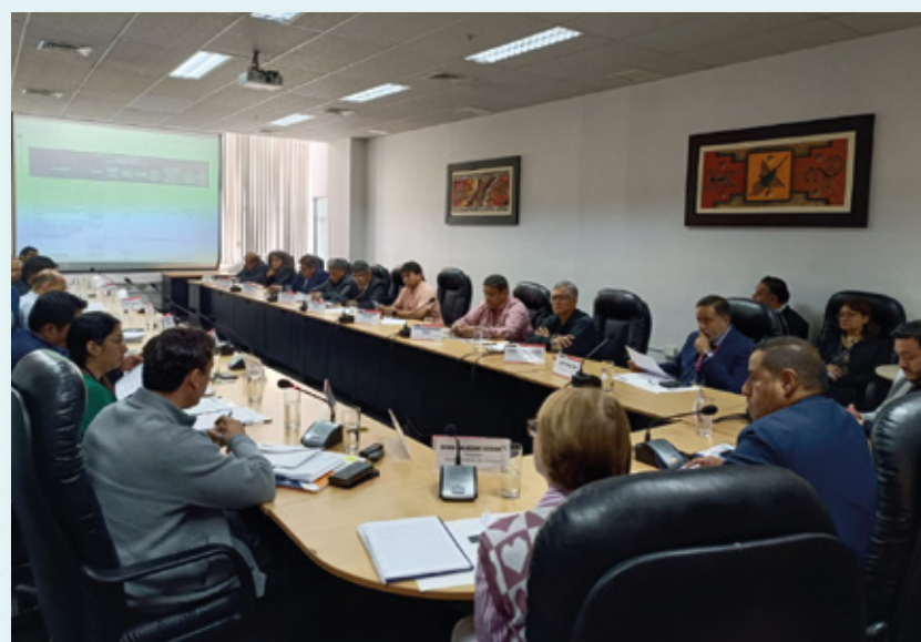
Cuarta sesión ordinaria, realizada el 31 de octubre

En la tercera sesión ordinaria, llevada a cabo el 25 de octubre, el Seguro Social de Salud realizó una presentación sobre los servicios y prestaciones en salud que brinda al sector pesca. A partir de lo planteado en la sesión, se conformó un subgrupo de trabajo integrado por representantes del Ministerio de Trabajo y Promoción del Empleo (MTPE), Ministerio de Salud (MINSAL), Seguro Social de Salud (ESSALUD), Ministerio de la Producción (PRODUCE) y un representante de los trabajadores, quienes se reunieron el 27 de octubre para: i) elaborar un proyecto de consulta al MINSAL sobre la posible cobertura del Sistema Integral de Salud (SIS) después del periodo de latencia aplicable a los trabajadores pesqueros, afiliados a EsSalud, durante la suspensión perfecta de labores y ii) priorizar los temas urgentes del sector pesca a ser abordados.