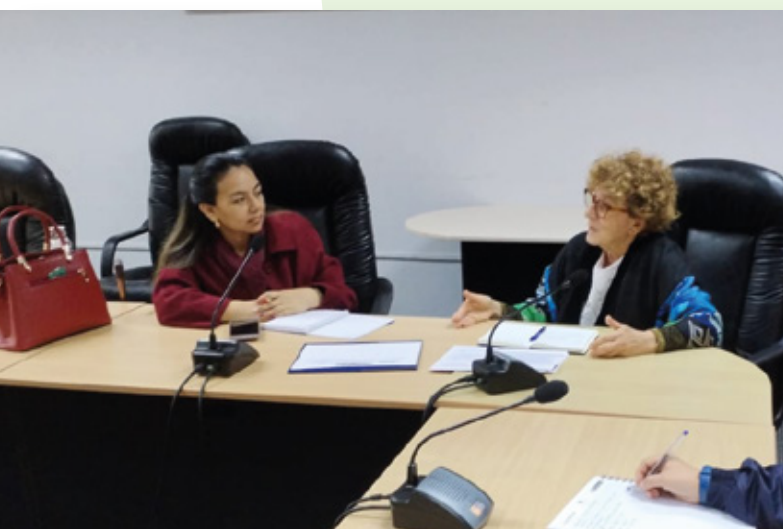
Reunión con los Conglomerados de Pequeñas Empresas en el Perú (CPEP)

Durante los meses de setiembre y octubre de 2023, la Secretaría Técnica del CNTPE llevó a cabo una serie de actividades en el marco del compromiso por fomentar la inclusión y participación de las poblaciones de especial protección en los espacios de diálogo sociolaboral, con un énfasis particular en organizaciones representadas por mujeres, jóvenes, personas con discapacidad y la comunidad LGTBI.